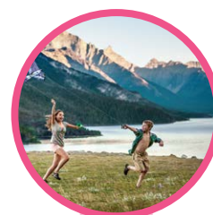
PARC INTERNATIONAL DES LACS WATERTON

Visitez le Boundary Ranch à Kananaskis, Alberta, et partez en randonnée à cheval en été, ou en chiens de traîneau en hiver