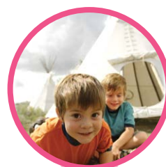
PRÉCIPICE À BISONS HEAD-SMASHED-IN