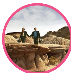
PARC PROVINCIAL DINOSAUR