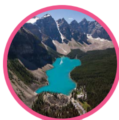
PARCS DES ROCHEUSES CANADIENNES