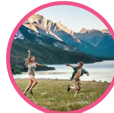
ウォータートン・グレーシャー国際平和公園