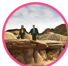
省立恐龙公园 (DINOSAUR PROVINCIAL PARK)